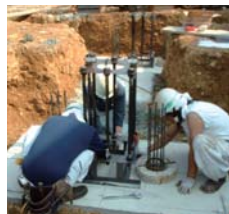
鉄骨用基礎アンカーボルト

どうして木造住宅にこだわるのか。重量鉄骨住宅の良さも知ってほしい。木造住宅の価格帯も様々。鉄骨の家か、木造の家か、比較検討して頂ける価格を下記標準仕様で実現したいと考えました。長期にわたる安心感をあなたに。