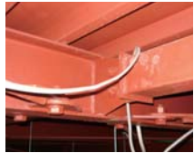
築20年経過した住宅の鉄骨部

メイジホームでは、1階の湿気が多い外壁部分は鉄骨材（C型鋼）またはACQ注入木材で囲みます。もちろん床下部分もACQ注入木材です。床下コンクリートの打ち込み前後の土壌処理、内部間仕切りの木材防蟻処理にて、シロアリ対策も万全です。